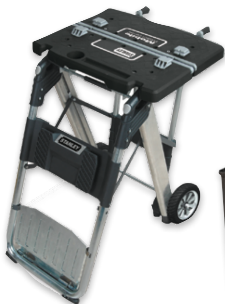
Stanley mobile project center