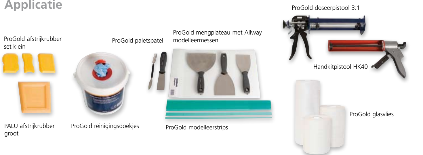
ProGold afstrijkkrubber set klein