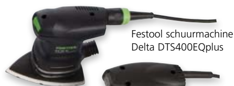
Festool schuurmachine Delta DTS400EQplus