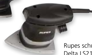
Rupes schuurmachine Delta LS21AVE