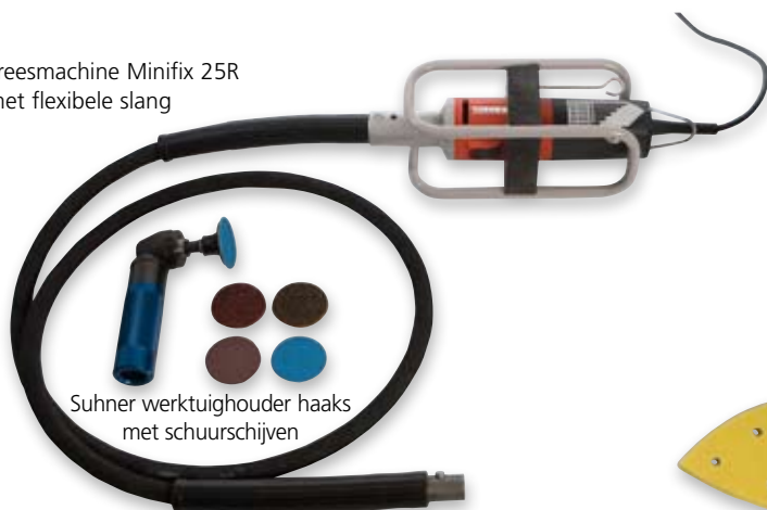
Suhner werktuighouder haaks met schuurschijven