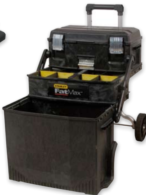
Stanley gereedschapswagen Fatmax