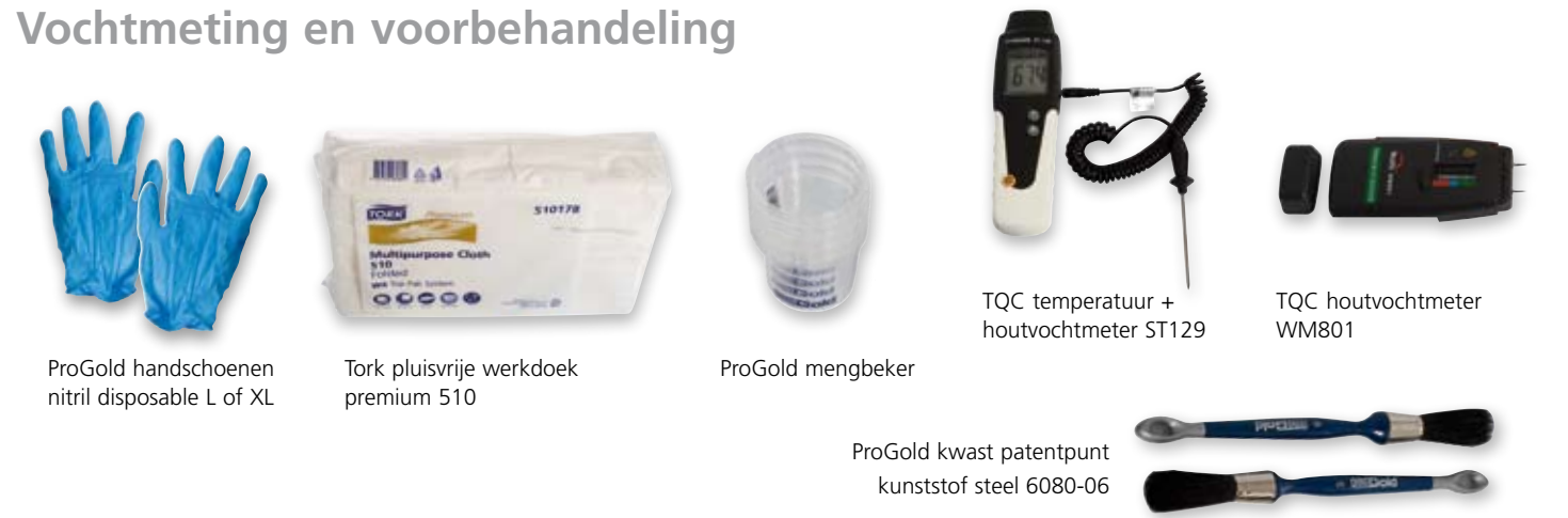
ProGold handschoenen nitril disposable L of XL